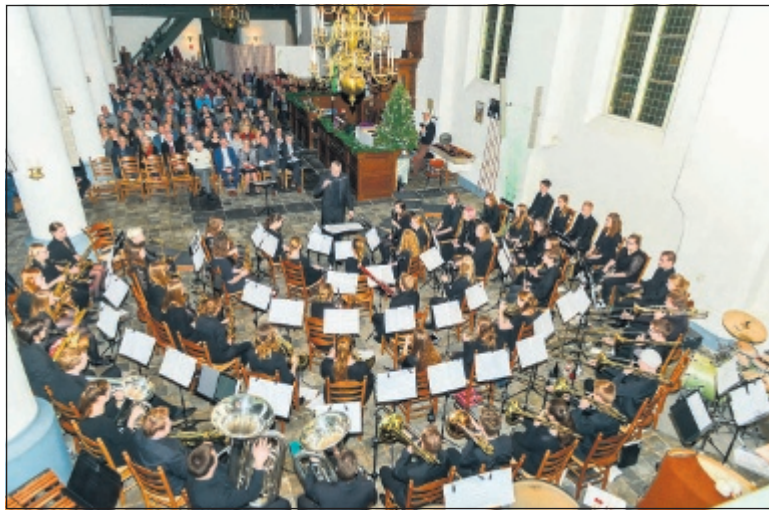
Een concert in een volle kerk, met kaarslicht, waar het publiek aandachtig luisterde naar het DJO en Cigale en uitbundig de bekende kerstliederen meezong.

Een bijzondere belevenis was het samengaan van kamerkoor Cigale met het DJO. Van achter uit de kerk liepen de zangers zingend naar voren met een zich herhalend Alleluja. Een dubbelkorig adventsmotet werd door enkele blazers van het DJO gespeeld. Helaas was die omspelings niet duidelijk te volgen door de onlogische opstelling van het groepje blazers achter de zangers, bijna onzichtbaar voor het publiek. Het beroemde Halleluja-